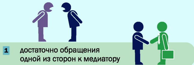
СХЕМА РАБОТЫ МЕДИАТОРА